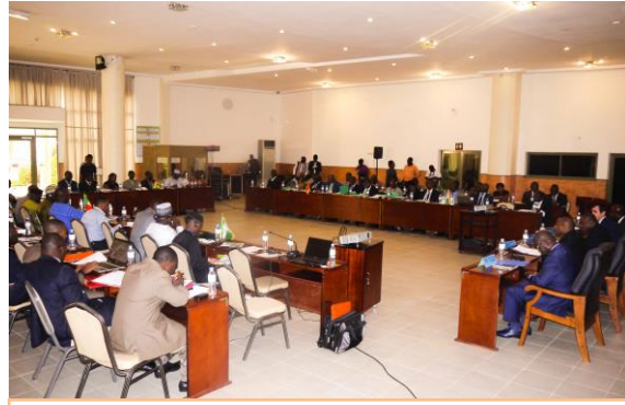
Vue partielle des participants

Ces défis devront guider les différents acteurs et parties prenantes dans l'atteinte de l'objectif de développement global du projet.